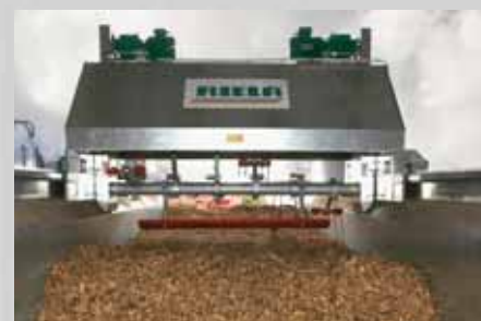
Vorschub und Drehfrequenz variierbar für alle Produkte