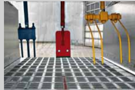
Wendewerkzeug für verschiedene Trocknungsgüter