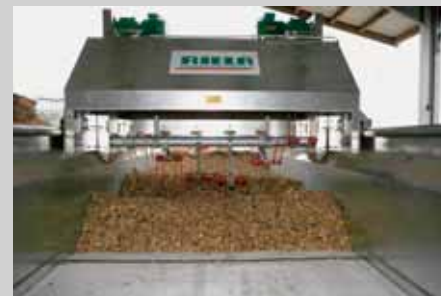
Schütthöhen von 40 - 400 mm möglich