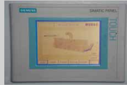
Schaltschrank mit SPS-Steuerung