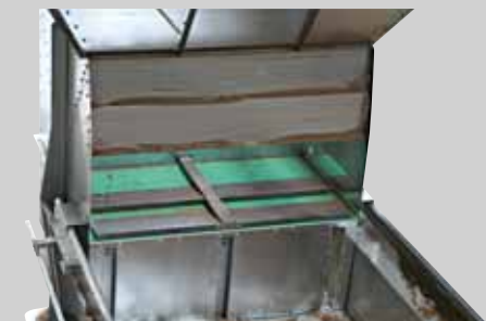
Dosiereinrichtung für das Trocknungsgut