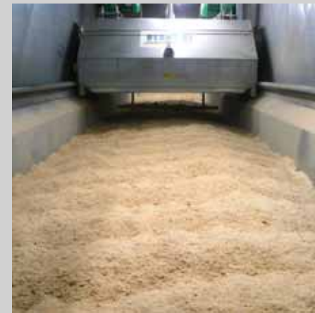
Trocknung von Sägemehl