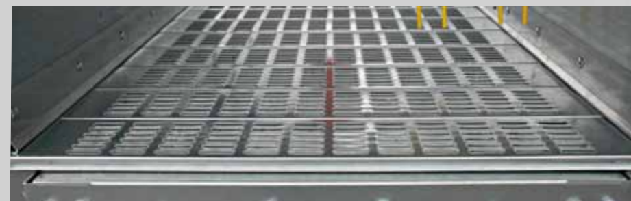
Schuppenboden: einfacher Einbau und optimale Belüftung