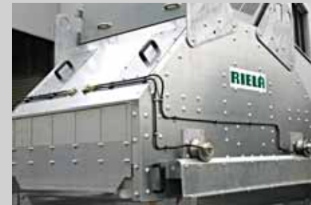
Zentrale Schmierung des Wendewagens